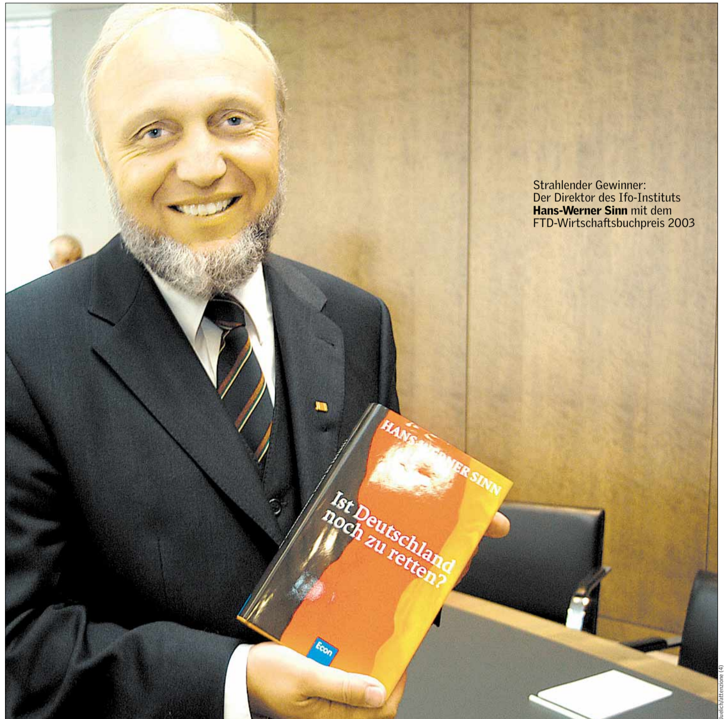
Strahlender Gewinner: Der Direktor des Ifo-Instituts Hans-Werner Sinn mit dem FTD-Wirtschaftsbuchpreis 2003